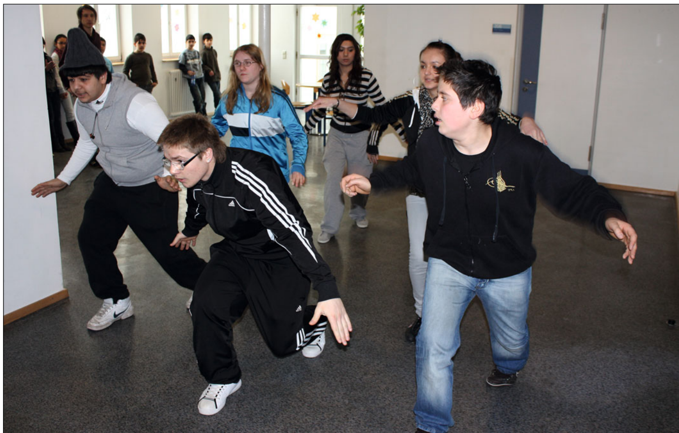
Monatelang übten SchülerInnen der Föhrich-Förderschule für ihren großen Auftritt im Theaterhaus Stuttgart