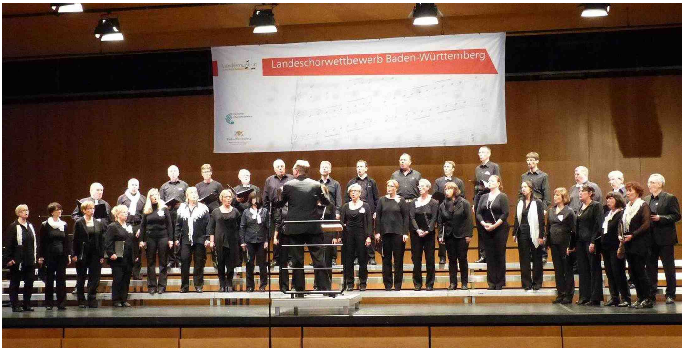
Der Kammerchor der Chorgemeinschaft Kai stellte sich den Herausforderungen in Donaueschingen.