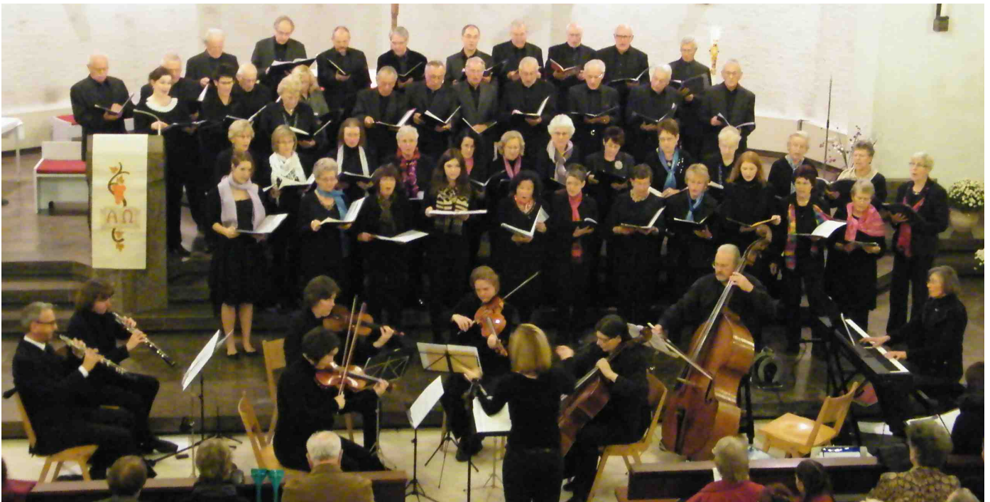
Die beiden Chöre, unterstützt durch ein Instrumentalensemble, musizierten in einer gut besetzten Kirche.