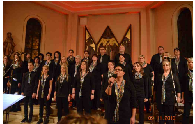
Das Publikum singend aus der Kirche hinausbegleitet.

Erst nach drei Zugaben konnte der Chor das Konzert beenden, aber auch nur deshalb, weil er das Publikum sin-