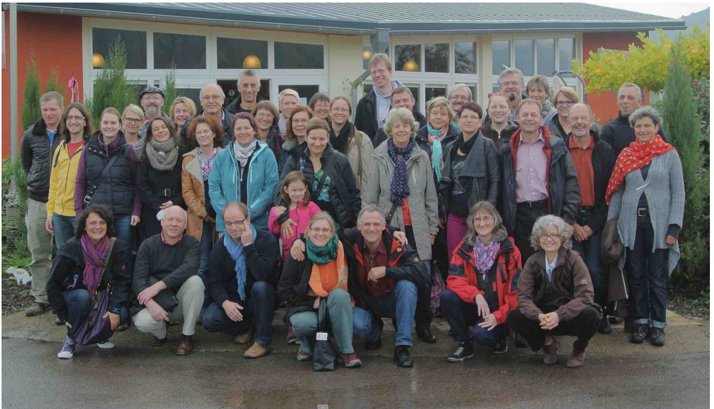
Der Tübinger Chor Voice Cream hat einen befreundeten Chor in Lorscheid an der Mosel besucht.