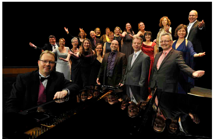
TonArt wurde 1994 als „Young Voices“ gegründet.

Bevor der Kammerchor der CG Kai Müller unter anderem mit zwei französischen Chansons große Begeisterung bei