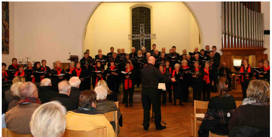
Der Daimler-Chor sang unter anderem Gounods Messe Brève.